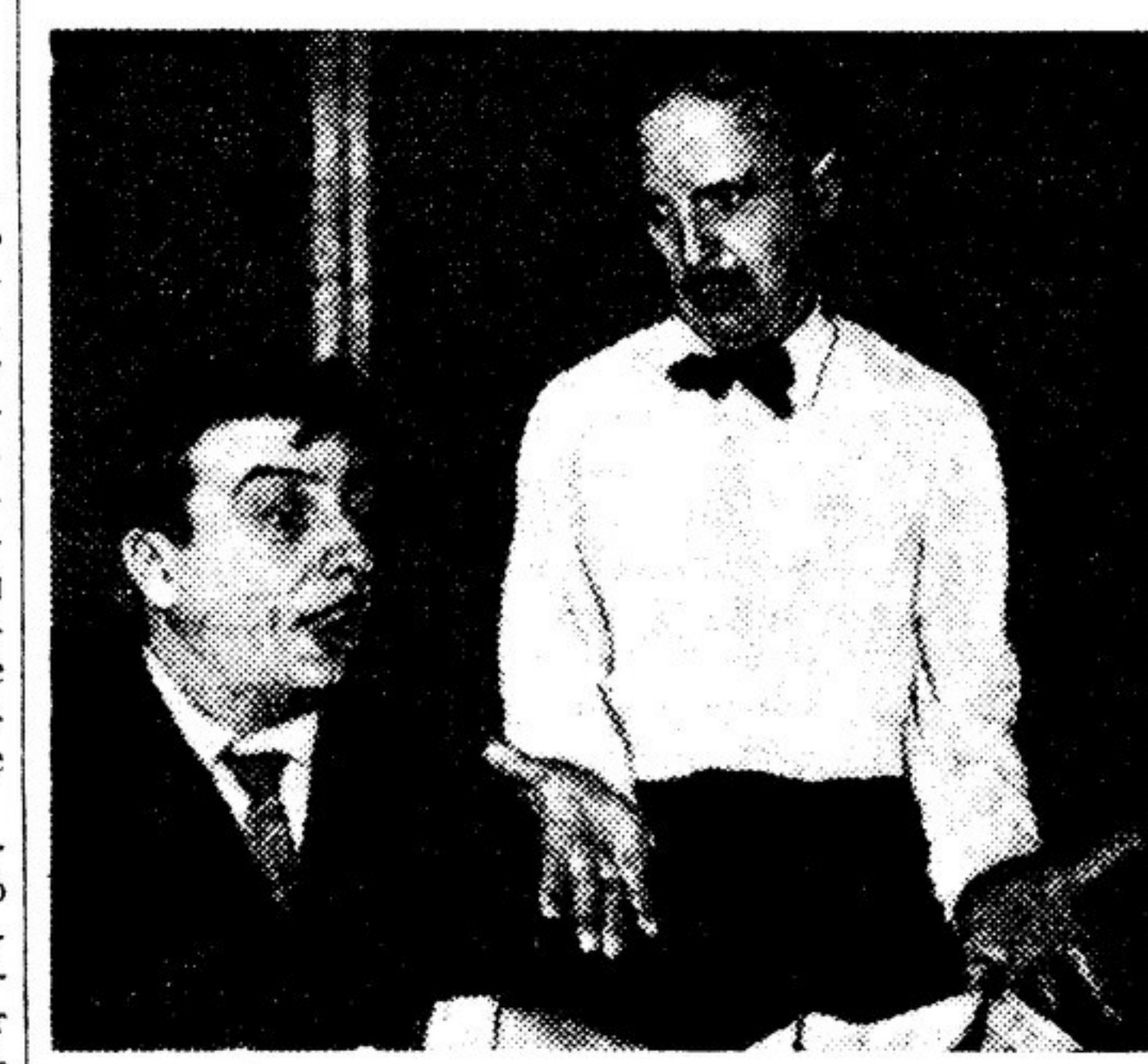
Господин Сибило получил нагоний от господина Жюль Палотэна. Сибило беспомощно разводил руками. Жюль Палотэна гневно тычет перстом в газетную страницу. Это сцена из первого акта новой пьесы Жана-Поля Сартра «Некрасов» и запечатлена на воспроизведенном нами клише.